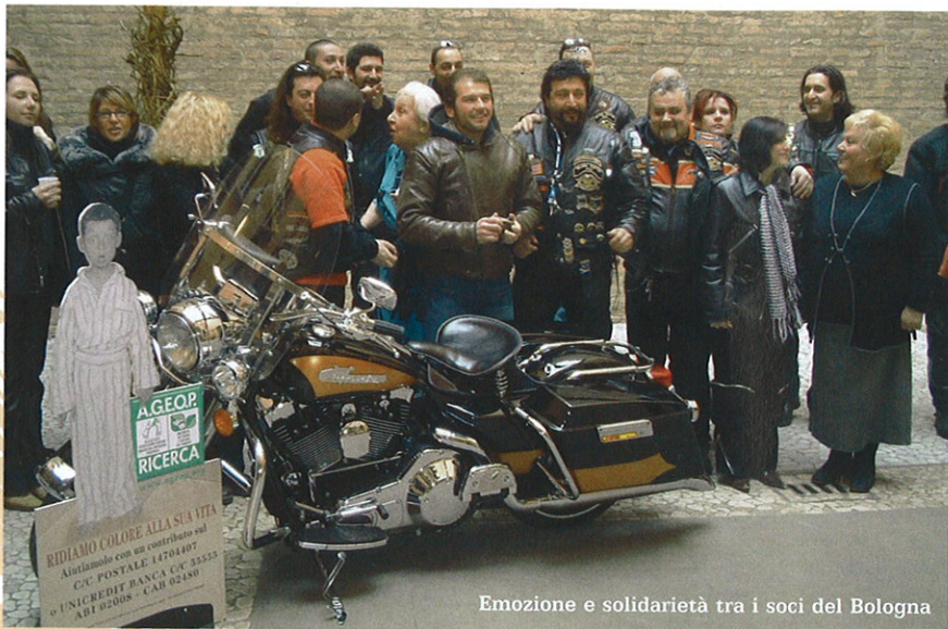
Emozione e solidarietà tra i soci del Bologna